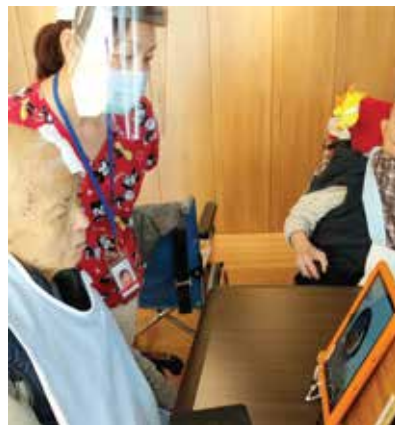
長者們通過視頻與家人聯繫