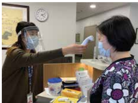
一名受過訓練的員工為上班的同事量體溫。

所有華宮員工在報到上班時需接受症狀檢查, 若出現任何症狀將立即接受 COVID-19 檢測, 直到報告證明沒有患上新冠病毒才能上班。