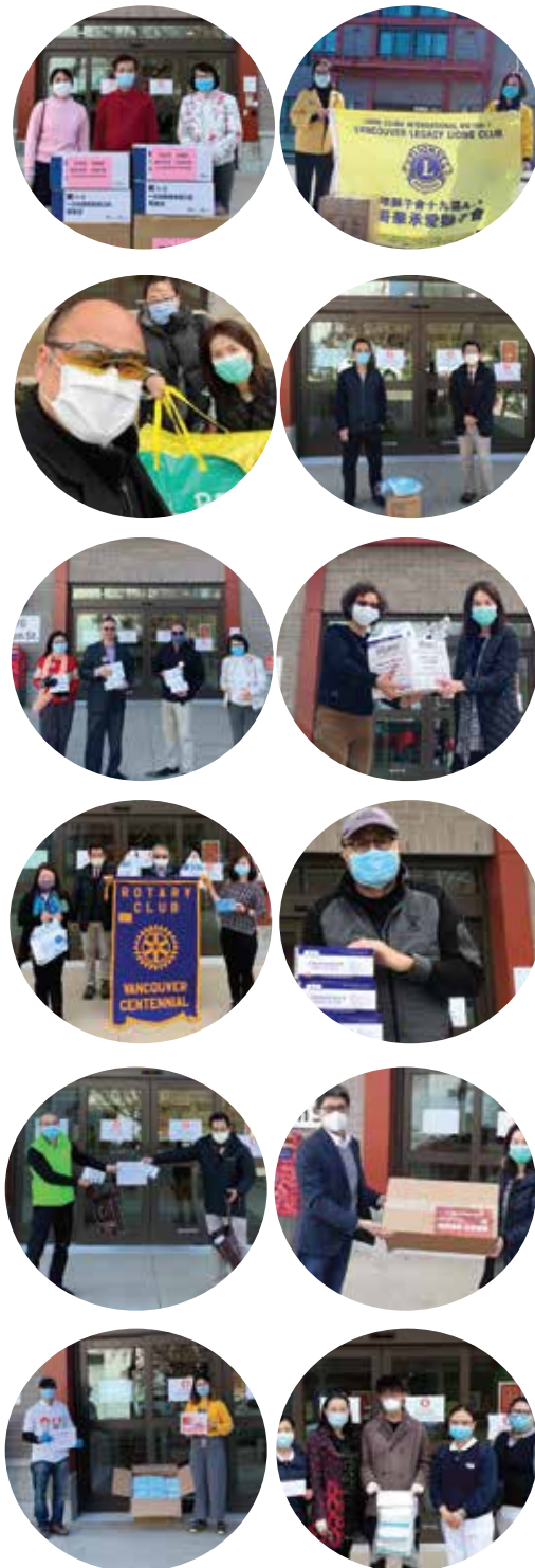
名單截至四月二十四號