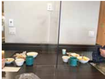
訂購隔離板，減低長者在進餐時感染的機會